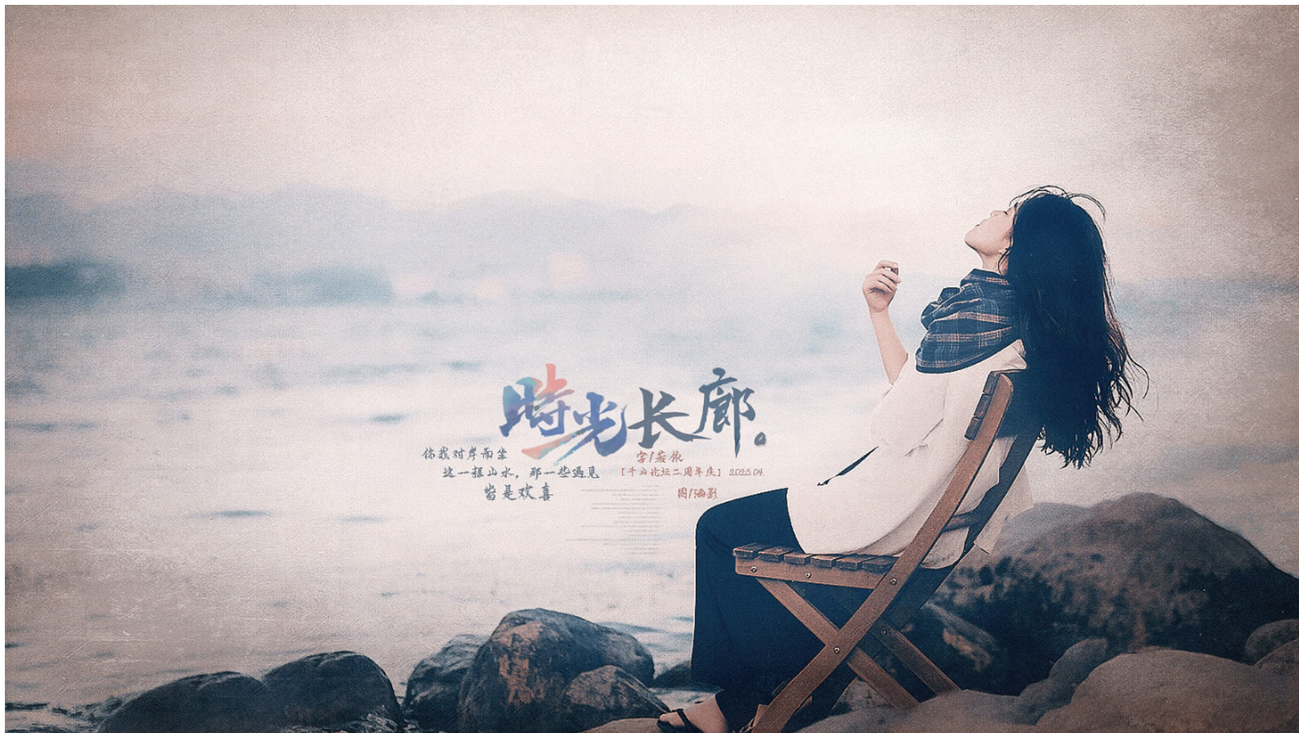
时光长廊。。贺千山二周年庆典（作者/玲珑心）