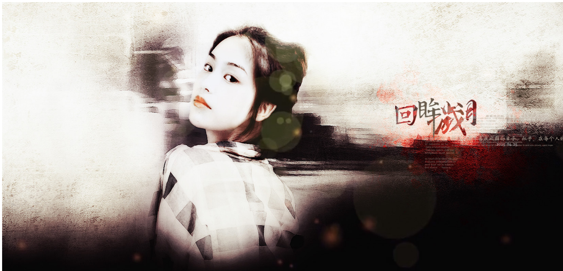
【落。单图】回眸岁月 作者 / 落字秋风句)