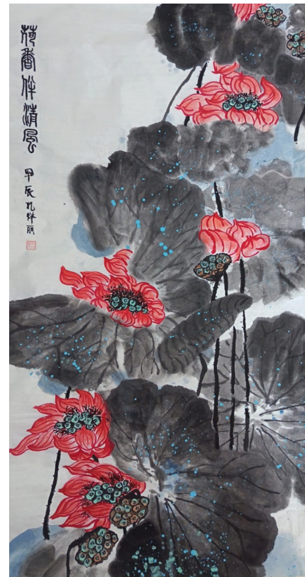
《荷香伴清风》作者 / 小九妹