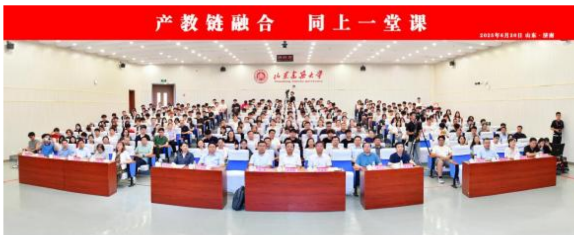
(2025年6月，“产教链融合 同上一堂课”活动)

强化理论与实践融合，共建教学研训平台。邀请高校教师加入企业培训团队，定期接收学生实习实践，推行“工地课堂+项目实训”双场景教学，覆盖造价咨询、工程管理等领域。联合开展课题研究与标准编制，共建案例库，围绕高标准住宅、碳中和造价影响等专题深化合作，编修企业实操手册，拓展多元主题。