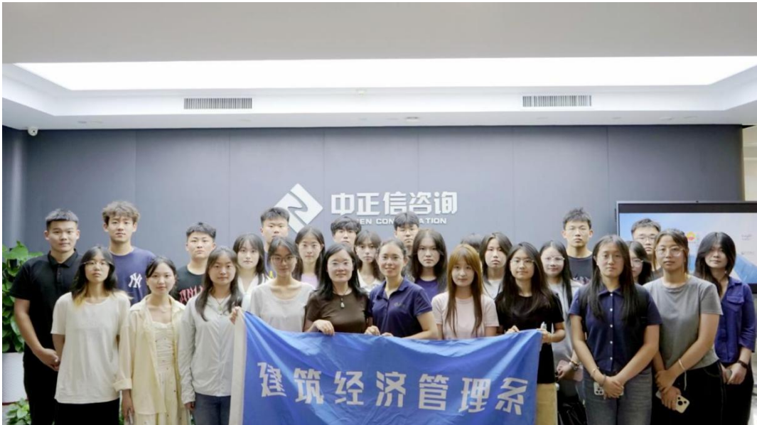
(2025年7月，山东城市建设职业学院造价专业学生代表走进企业)

全咨讲堂拓展视野。通过“全过程工程咨询讲堂”引导学生从传统算量套价转向全流程咨询，明确“三年筑基、五年跨界、十年领航”的职业路径，为培养新时代全过程咨询人才提供参照体系。