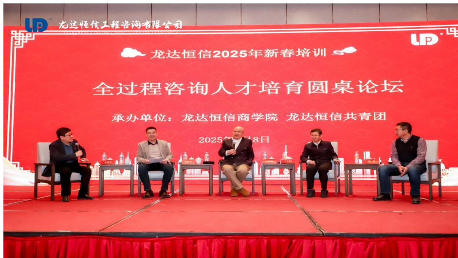
(2025年2月，龙达恒信2025年新春培训)

龙达恒信工程咨询有限公司、山东建筑大学管理工程学院、山东省工程建设标准造价中心联合设立全过程造价咨询人才培育流动站，构建多维融通的产教协同育人体系，着力打造工程造价咨询行业技术升级与人才培养的衔接通道。